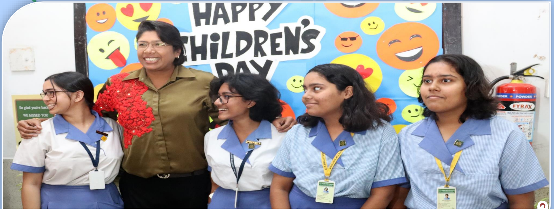
Pitch Perfect Motivation By Jhulan Goswami