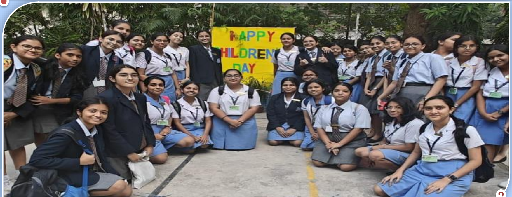
A Joyful Dedication To Children